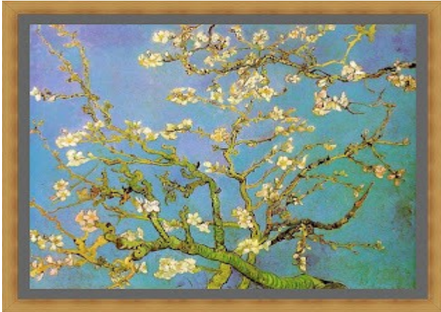
Vincent van Gogh

Przygotowaliśmy minigalerię, która dowodzi niezwyklej wrażliwości malarzy na piękno świata, którzy niejako "odczuwają" naturę. Z drugiej strony pojawia się refleksja, że tak popularny motyw za każdym razem można ukazać w sposób niepowtarzalny, odkrywczy, aczkolwiek niezmiennie piękny.