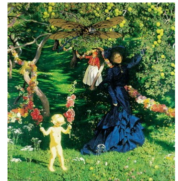
Dziwny ogród Józef Mehoffer