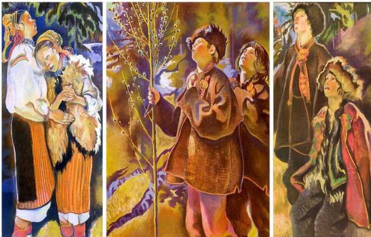
Niedziela palmowa (tryptyk) Kazimierz Sichulski